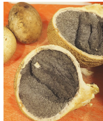
Nicht essen! Aufgeschnittene giftige Händöpfelboviste.

Damit tun die beiden Damen einen wertvollen Dienst für die Volksgesundheit. Selbstverständlich ist auch in der «Amtlichen Pilzkontrollstelle» ein Schutzkonzept nach BAG-Vorgaben vorhanden: Maske tragen, Abstand halten und maximal sechs Personen dürfen sich gleichzeitig im Raum aufhalten. Desinfektionsmittel steht ebenfalls parat.