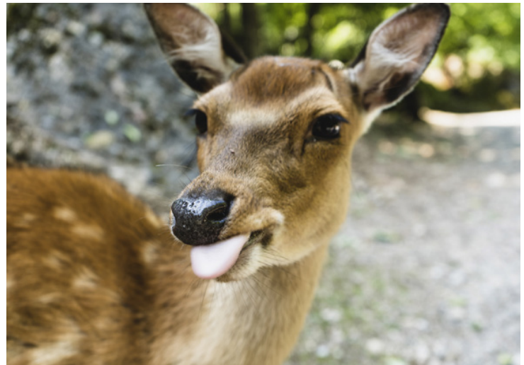
Die Jagdsaison ist eröffnet.

Velofahrer können dazu neigen, solche Verbote zu missachten. Diese sind zu höchster Vorsicht aufgerufen, da Zusammenstösse mit Hunden oder Rehen eindeutig zu Ungunsten der Velofahrer ausgehen. Aus Sicherheitsgründen ist der Hardwald an den beiden Jagdtagen auch für Fussgänger gesperrt, gemäss einer Verfügung der Sicherheitsdienste der Stadt Kloten und Wallisellen. Die Waldeingänge sind mit Merkblättern versehen und mit Signal-